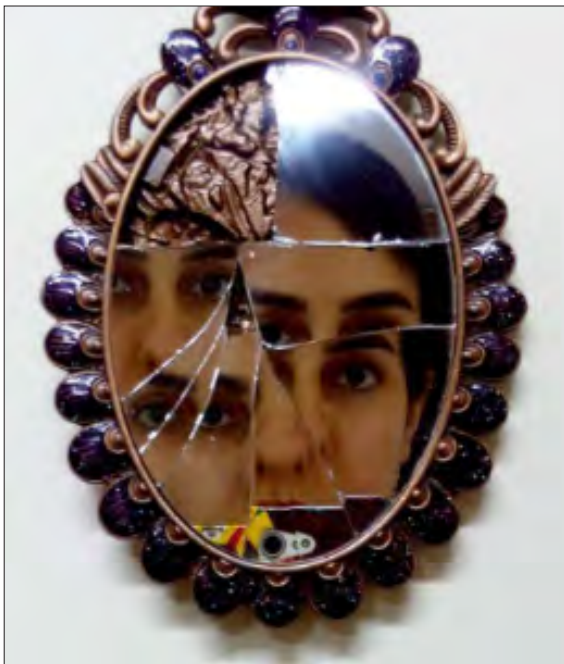
تصویر ۸- طبیعت بی جان، ظرف میوه و کارت‌ها، جرج براک، ۱۹۱۳ م.، موزه ژورژ پومپیدو، پاریس. کوئیسیم ترکیبی، مأخذ: گاردنر، ۱۳۸۰.