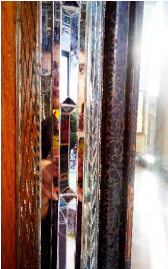
تصویر ۵- قسمتی از آینه‌کاری خانه زینت الملوک شیراز، علی محمدخان قوام الملک دوم، ۱۲۹۰ ه. ق.