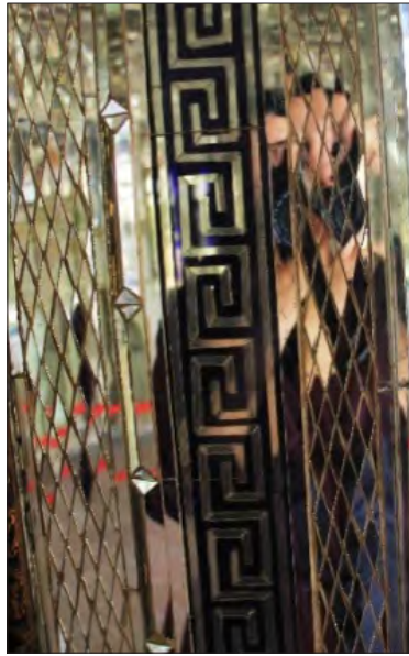
تصویر ۹- سمتی از آینه‌کاری خانه زینت‌الملوک شیراز، علی محمد خان قوام‌الملک دوم، ۱۲۹۰ ه.ق.