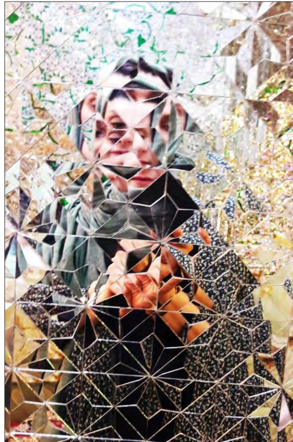
تصویر ۱- قسمتی از آینه‌کاری حرم حضرت شاهچراغ (ع)، شیراز مأخذ: نگارندگان.

بیانجامد، یعنی همان اصلی که هنرمندان انتزاع‌گرای سده بیستم به دنبال آن بودند. در کوبیسم تحلیلی نیز موضوع اثر تجزیه و تحلیل، و سپس دوباره روی بوم به صورت چندین سطح تصویری تجسمی و دارای پرسپکتیو بازسازی می‌شد تا موضوع اثر در تمامیت آن ارائه گردد. از ۱۹۰۹ به مدد شبکه‌های بازی با نور، براق و پیکاسو این دو هنرمند پیشگام کوبیسم طرح‌های تجسمی و حجم‌ها را شکسته و آنها را تجزیه کردند. سطح اثر به عناصر ظریف هندسی تجزیه شد که ویژگی آنها داشتن رنگ سایه‌های کم و بیش تند نور بود. با وجود این، نقاط تلاقی روشن طرح‌ها که تشکیل دهنده تار و پودهای پیوسته بودند و عمق را از بین می‌بردند، تجزیه و تحلیل فرم‌ها را بیش از پیش سخت و پیچیده می‌کردند (پارمزان، ۱۳۹۰: ۲۳). تجدید نظر در فضای تصویری سنتی ذهن بسیاری از هنرمندان مدرن را مشغول داشته بود، از دیدگاه پیکاسو «برای شناخت کیفیت چیزها نمی‌توانیم به ظاهرشان، یعنی آن طور که از زاویه‌ای معین دیده می‌شوند، بسنده کنیم، نه فقط باید