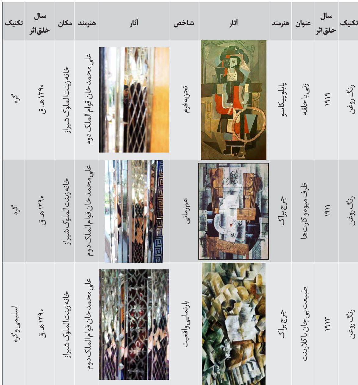
جدول ۳- تجزیه و تحلیل نشانه‌های بصری در آینه‌کاری ایرانی و نقاشی‌های کوبیسم براک و پیکاسو، مأخذ: نگارندگان، ۱۳۹۷

پارارتعاش ترو و ملموس ترمی کردند (تصویر ۱۰) (کوپر، ۱۳۶۶: ۵۶).