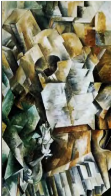
تصویر ۱۰- چرخ برآک، طبیعت بی‌جان با کلارنیت، ۱۹۱۱