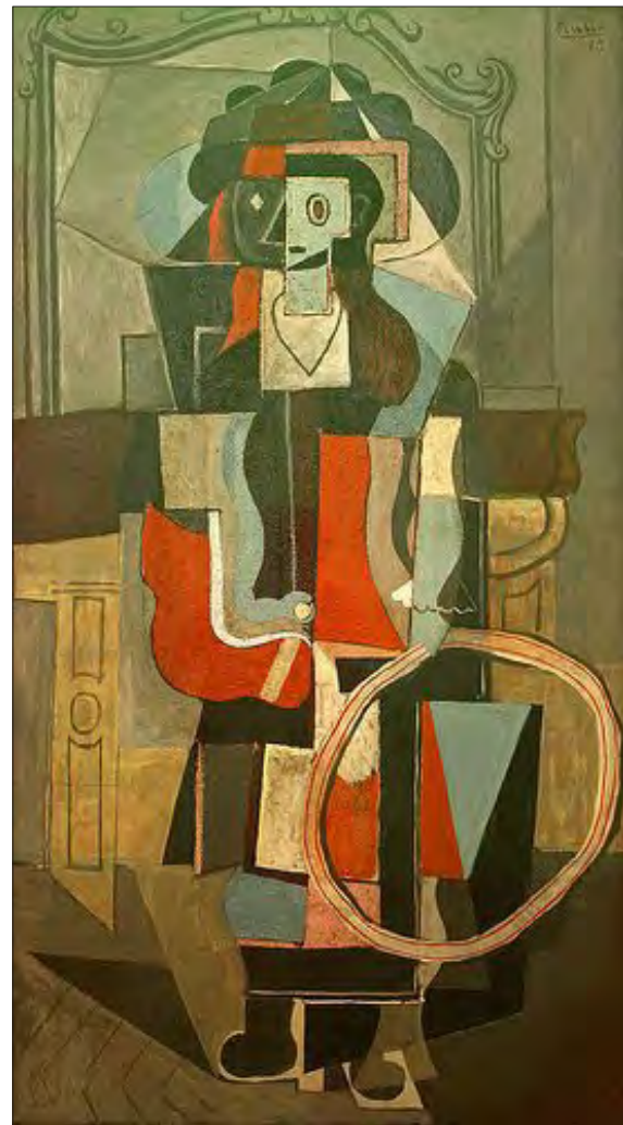
تصویر ۳ - پابلو پیکاسو، زنی با حلقه، ۱۹۱۹، مأخذ: گاردنر.

آینه کار بر آن است که بیننده موضوع را از زوایای دید مختلف ببیند. بنابراین یک طرح هندسی از خطوط عمودی، افقی و مورب را روی دیوار سامان می دهد که موجب توسعه فضا می شود. وی با نشان دادن وجوه مختلف شیء از زوایای