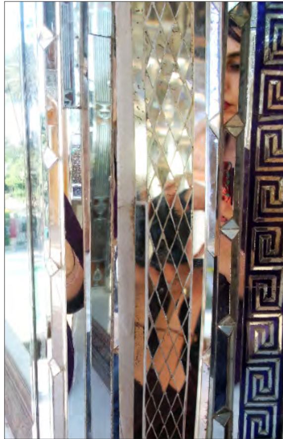
تصویر ۴- قسمتی از آینه‌کاری خانه زینت الملوک شیراز، علی محمدخان قوام الملک دوم، ۱۲۹۰ ه. ق.

آنی، که در ذهن تماشاگر فرمول بندی می‌شود و به صورت رمز درمی‌آید» (آرناسون، ۱۳۶۷: ۱۱۶-۱۱۷). بیننده قطعاتی از یافته‌های بصری اشیاء را به منزله عناصر شکل‌پردازی شده ذهن خویش به کار می‌بندد. در این روش شکل‌های مادی شیء تا آن حد کژنما می‌گردند که فقط به مدد یک تحلیل معکوس دقیق امکان بازسازی دارند و روند انتزاعی کردن فرم و فضا تا آنجا پیش می‌رود که وابستگی اشیاء به حداقل می‌رسد. نوعی پرسپکتیو مرکب حاصل از دیدگاه‌های متعدد فضا را به حرکت درمی‌آورد و ابعادش را تغییر می‌دهد. به سخن دیگر «وجه مختلف شیء بازنمایی و کنار هم نهاده می‌شود به گونه‌ای که منظر جزئی، به مدد یافته‌های واقعیت منظر کلی شیء را به ذهن تماشاگر متبادر می‌کند. گویی هنرمند به دور شیء می‌چرخد و از مهم‌ترین وجه صوری و ساختاری آن، نمودار نگاشت‌ها یا دیاگرام‌هایی برمی‌دارد و اینها را به طور ذهنی برهم می‌نهد تا یک تصویر کلی را عرضه بدارد» (پاکباز، ۱۳۸۱: ۴۸۰).