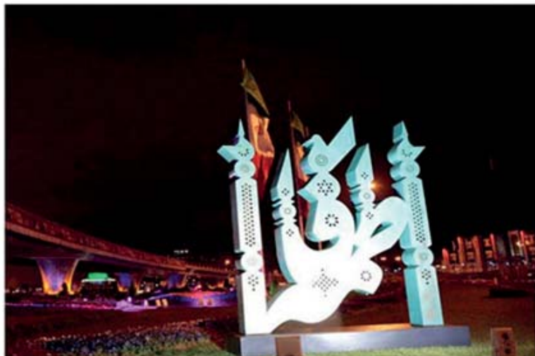
تصویر ۱- طراحی المان حجمی با استفاده از نقوش اسلامی و خوش‌نویسی ایرانی و اسلامی مشهد (۱۳۹۴) (URL5).