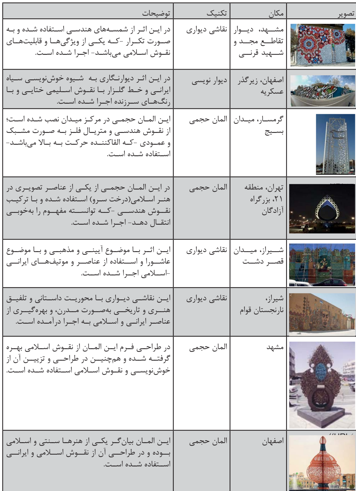
جدول ۱. بررسی به‌کارگیری نقوش اسلامی در گرافیک شهرهای اسلامی