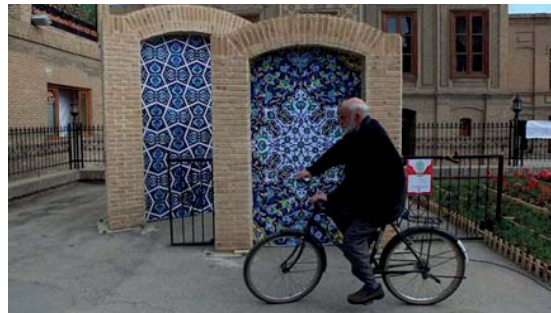
تصویر ۷- استفاده از نقوش هندسی جهت گرافیک پیاده‌رو، مشهد (۱۳۹۴) (URL11).

کفشچیان‌مقدم، ۱۳۹۱: ۸۶). برای نمونه «بهره‌گیری از طرح‌ها و مدل‌های هنر کمینه در آثار دیواری معاصر، سبب می‌شود اثر دیواری از موضوع همیشگی خود دور شود؛ و به تزیین -که یکی از عناصر اصلی در هنر ایرانی اسلامی است- نزدیک شود. استفاده از قابلیت‌های این گرایش هنری، به‌خوبی می‌تواند به احیا و نو کردن فضای شهری (گرافیک محیطی) از طریق نقاشی دیواری و گاه، تلفیق نقاشی دیواری با معماری کمک شایانی کند» (همان: ۹۴).