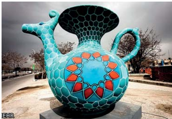
تصویر ۲- استفاده از نقوش هندسی و اسلامی در المان حجمی، مشهد(۱۳۹۲)(URL11).

فضای زیست اجتماعی ما کمک می‌کنند، بلکه به‌عنوان نمادها و نشانه‌هایی از فرهنگ و هویت جمعی ما قابل استناد هستند؛ و از این بابت است که باید رویکردی تازه‌تر و جدی‌تر به آن‌ها داشت؛ بنابراین، در طراحی و ساخت و یا به‌کارگیری این حجم‌ها در فضای شهری باید از نهایت فکر و اندیشه انسانی بهره گرفت؛ و باید در مورد استفاده از حجم‌ها، تندیس‌ها و یادمان‌ها از نمونه‌هایی استفاده کرد که، سازگاری بیش‌تری با فرهنگ ایرانی و اسلامی دارند و از به‌کارگیری مجسمه‌ها با اشکال و ابعاد غیر مرتبط و بیگانه اجتناب کرد(تصویر ۱).