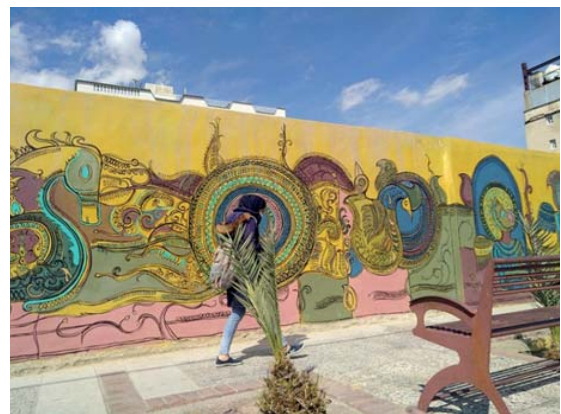
تصویر ۴- نقاشی دیواری با استفاده از عناصر و موتیف‌های ایرانی اسلامی، شیراز، خیابان هجرت (۱۳۹۷) (URL7).

کفشچیان‌مقدم، ۱۳۹۱: ۸۶). برای نمونه «بهره‌گیری از طرح‌ها و مدل‌های هنر کمینه در آثار دیواری معاصر، سبب می‌شود اثر دیواری از موضوع همیشگی خود دور شود؛ و به تزیین -که یکی از عناصر اصلی در هنر ایرانی اسلامی است- نزدیک شود. استفاده از قابلیت‌های این گرایش هنری، به‌خوبی می‌تواند به احیا و نو کردن فضای شهری (گرافیک محیطی) از طریق نقاشی دیواری و گاه، تلفیق نقاشی دیواری با معماری کمک شایانی کند» (همان: ۹۴).