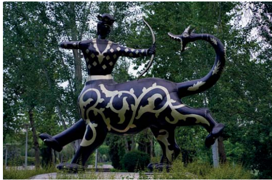
تصویر ۳- بهره‌گیری از نقوش اسلامی(اسلمی) در مجسمه شهری، اصفهان(۱۳۹۹)(URL3).