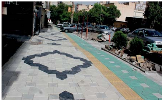
تصویر ۶- استفاده از نقوش هندسی کفپوش پیاده‌رو، خیابان ولی عصر، تبریز (۱۳۹۴) (URL8).

عابران پیاده اختصاص می‌یابند. پهنه پیاده‌رو، مکانی است که ساکنان آن با هر سن و توانایی می‌توانند امنیت و راحتی، تناسب و جذابیت در پیاده‌روی را نه تنها در هنگام فراغت، بلکه در استفاده از تجهیزات و آمد و شد نیز احساس کنند؛ بنابراین، کف‌سازی فضای پیاده‌رو از اهمیت زیادی در محیط‌های شهری برخوردار است. چرا که از یک سو، باعث زیبایی و جذابیت فضا شده و از سوی دیگر، از لحاظ عملکردی سهولت تردد را ممکن می‌سازد. «از آنجایی که در فضای شهری مخصوص پیاده، پیاده‌روها با فضای اطراف در تعامل یک‌دیگر قرار دارند، رعایت یک سری اطوال در طراحی این فضاها به زیبایی بصری و مطلوبیت این مسیرها از دیدگاه شهروندان می‌افزاید و سبب جذب شمار بیش‌تری از افراد به پیاده‌رو می‌گردد» (درویشی، ۱۳۹۵: ۱۱۴). بنابراین، در شهرهای امروزی ضرورت رویکرد مجدد به حرکت پیاده، به‌عنوان سالم‌ترین روش حمل‌ونقل شهری، باید به طور جدی مورد توجه طراحان شهری قرار گیرد. استفاده از طرح‌های بدیع در طراحی کفپوش و رعایت بین رنگ‌ها به طور قابل ملاحظه‌ای به جذابیت و دلپذیری محیط می‌افزاید. لازم به ذکر است، که در کف‌سازی مسیرها می‌توان با استفاده از رنگ‌های خاص و در جهت مسیر حس پویایی را در فرد تقویت نمود (زنگی‌آبادی و تبریزی، ۱۳۸۳: ۲۳) (تصویر ۶).