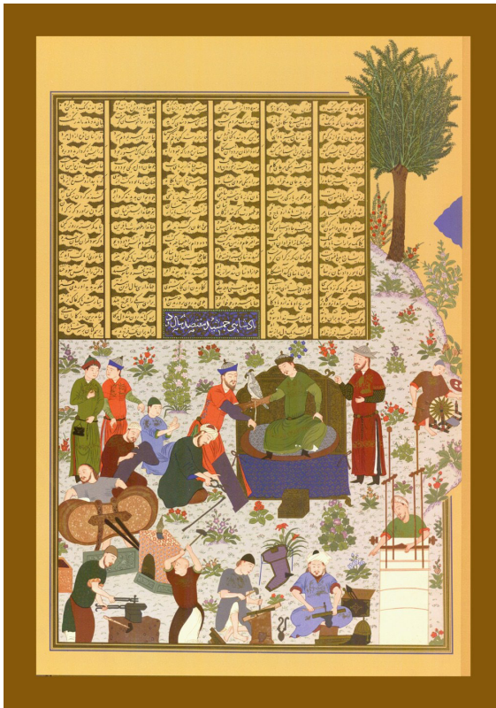
تصویر ۲. نگاره پادشاهی جمشید، شاهنامه بایسنقری.

ملقب به بایسنقر میرزا بهادرخان نوه تیمور و فرزند سوم شاهرخ بعد از الغیغ و ابراهیم سلطان بود. (یزدی، ۱۳۳۶: ۵۲۲) براساس منابع دست اول و مستندات تاریخی باید گفت بایسنقر میرزا، شخصیتی فرهیخته، هنرمند، هنردوست و هنرپرور بود. (یعقوبی هشجین، ۱۳۹۵: ۴۵) میرخواند درباره هنرپروری و دانش دوستی بایسنقر میرزا نقل می‌کند: «غیاث‌الدین میرزا بایسنقر فرزند شاهرخ، به هوش و کیاست و شجاعت و دانش دوستی و هنرپروری، موصوف بود. فضلا و دانشمندان و هنرمندان و پیشه‌وران، برای ادب دوستی و دانش‌پروری او، از اکناف مملکت، روی به درگاه او می‌آوردند... مهندسان و نقاشان در تذهیب و تصویر کار به جایی رساندند که مزیدی بر آن متصور نبوده است.» (میرخواند، ۱۳۷۵: ۳ / ۱۱۶۵) در مطلع‌السعدین و مجمع‌البحرین نیز آمده است: «... در همه احوال مجالست اصحاب کمال و مخالفت اهل علم و ارباب فضل بر خود فرض عین و عین فرض می‌دانست... و انواع هنرمندان و پیشه‌وران را به نوعی تربیت فرمود که هر یک و حید زمان و یگانه دوران شدند.» (سمرقندی، ۱۳۸۳: ۴۳۱ / ۲ و ۴۳۰) هم‌چنین در بخش دیگری از این منبع