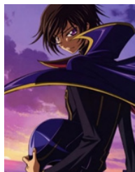
تصویر ۵: نمایی از انیمیشن کد گیاس

ترکیب‌های رنگی تأثیر گرفته از طراحی‌های دیجیتال در تصویرگری‌های کتاب‌های نوجوان ایرانی است که در مواردی کاملاً با فضای داستان سازگار است (مانند نمونه (۱۱) که تصویری از پیامبر و یکی از کافران را نشان می‌دهد که مشابه صحنه‌های رزم در انیمیشن‌های ژاپنی است). از ویژگی‌های رنگی طراحی‌های دیجیتال می‌توان به درخشندگی و خلوص بیشتر اشاره کرد. همان گونه که در تصویر (۵)، (۶) و (۷) مشاهده می‌کنید رنگ‌های بنفش، سرخابی، آبی و موارد مشابه با بیشترین درجه خلوص به کار رفته است. استفاده از همین ترکیب‌های رنگی در نمونه‌های (۷)، (۸) و (۹) آشکارا قابل تشخیص است. در نهایت، تأثیرات انجام گرفته از فضاها تصویرگری