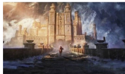
تصویر ۴: نمایی از انیمیشن ویچر