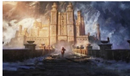
تصویر ۴: نمایی از انیمیشن ویچر