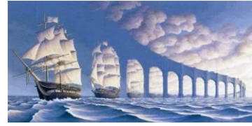
تصویر ۱: نقاشی «به سمت افق» اثر راب گونزالوز