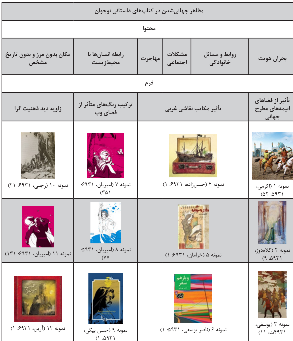
جدول ۱: مظاهر جهانی شدن در کتاب‌های داستانی نوجوان

بیشتر به مؤلفه‌های هویتی سرزمینشان بپردازند. مطالعه کتاب‌های نمونه پژوهش، مصداقی برای این نظریه است، زیرا بیش از ۱۱۰ اثر از ۱۷۰ اثر نمونه به بازنمایی هویت ملی و مؤلفه‌های اصلی هویت ملی در ایران پرداخته‌است که به چهار گروه هویت مکانی یا سرزمین مشترک، هویت تاریخی، هویت فرهنگی و هویت دینی گروه‌بندی می‌شود.