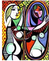
تصویر ۲: نقاشی «زنی در آینه» اثر پابلو پیکاسو