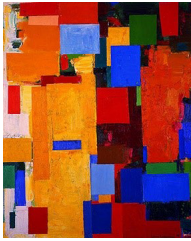
تصویر ۳: نقاشی «اعتدال شب و روز» اثر هانس هافمن