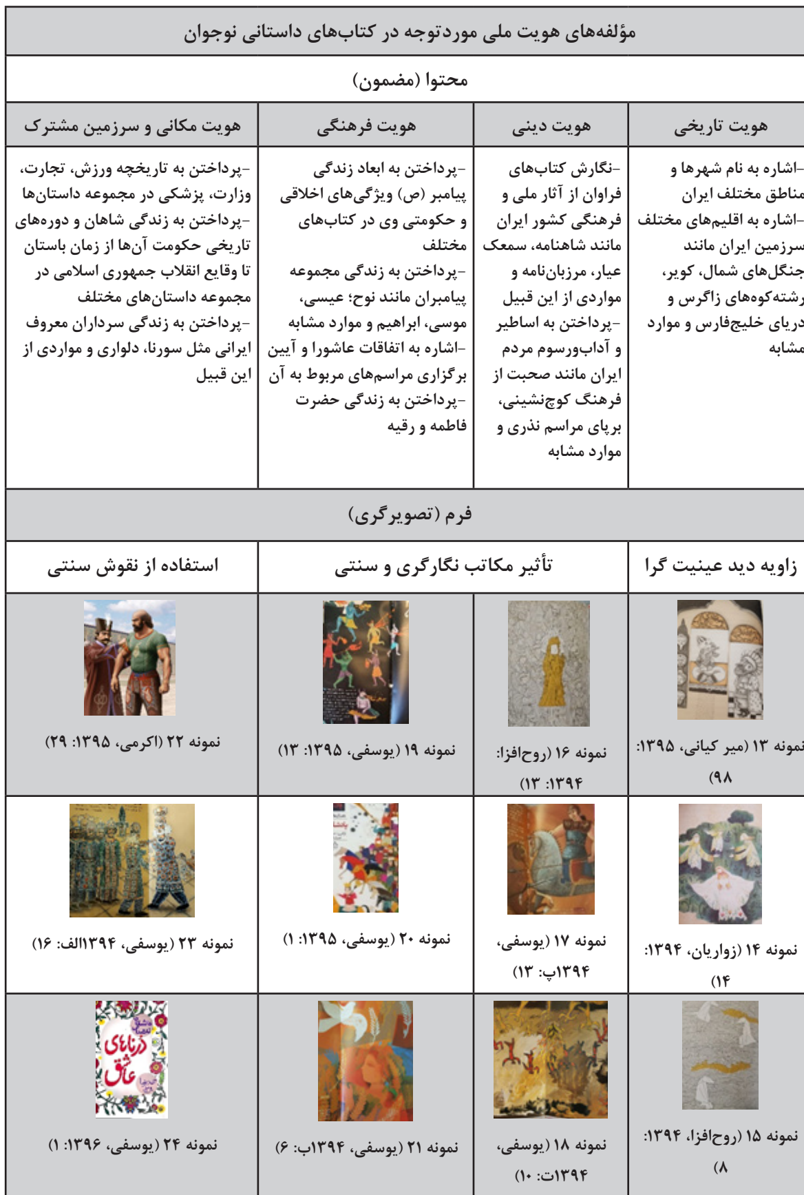
جدول ۲: مؤلفه‌های هویت ملی مورد توجه در کتاب‌های داستانی نوجوان (منبع: نگارندگان، ۱۴۰۰)