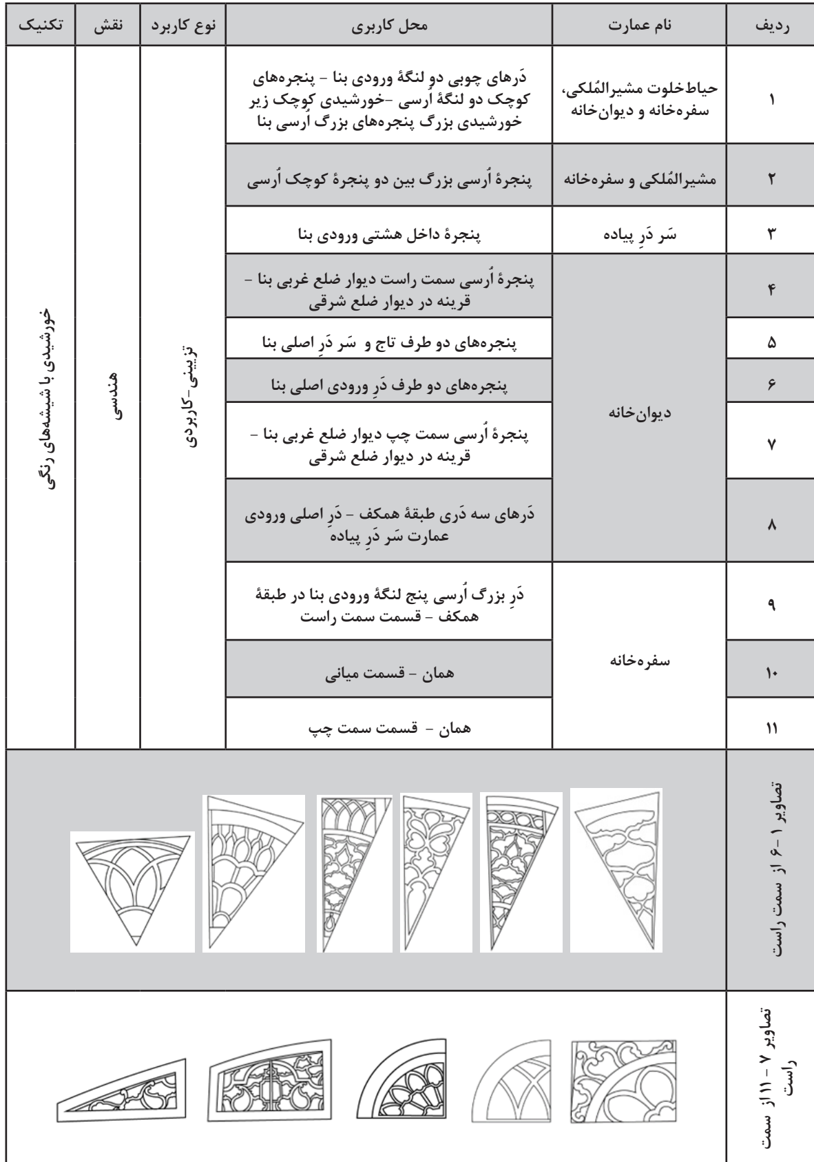
جدول ۷: ترسیم خطی واگیره‌های خورشیدی‌های درها و اُرسی عمارت مسعودیه