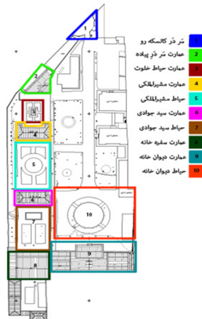
شکل ۱: پلان اصلی عمارت مسعودیه، ۱۴۰۰