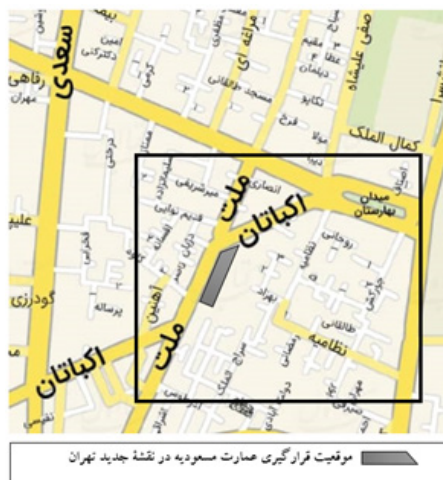
شکل ۲: خیابان‌های دسترسی به عمارت مسعودیه در نقشه جدید شهر تهران، ۱۴۰۰، (URL 1)

آیکونولوژی در حقیقت یک شبه‌آنالیز فرمی است و موضوع اولیه یا طبیعی را در بردارد و به‌وسیله بررسی نقش‌مایه‌ها و فرم‌های نابی که دربرگیرنده معانی اولیه و طبیعی هستند، موضوعات واقعی و بیانی را از یک‌دیگر شناسایی می‌کند (عبدی، ۱۳۹۰: ۳۲-۳۳). مرتبه دوم یا تحلیل آیکونوگرافی به معرفی موضوع اثر، داستان‌ها و شخصیت‌های حاضر در آن می‌پردازد. این تحلیل شناختی است که مخاطب نسبت به موضوعات یا مفاهیم ویژه منتقل‌شده از راه منابع ادبی، مذهبی یا سنت‌های شفاهی، به دست می‌آورد (پانوفسکی، ۱۳۹۶: ۴۴). در این مرتبه از معنا، برخلاف مرتبه نخست، هنگامی که در یک اثر هنری