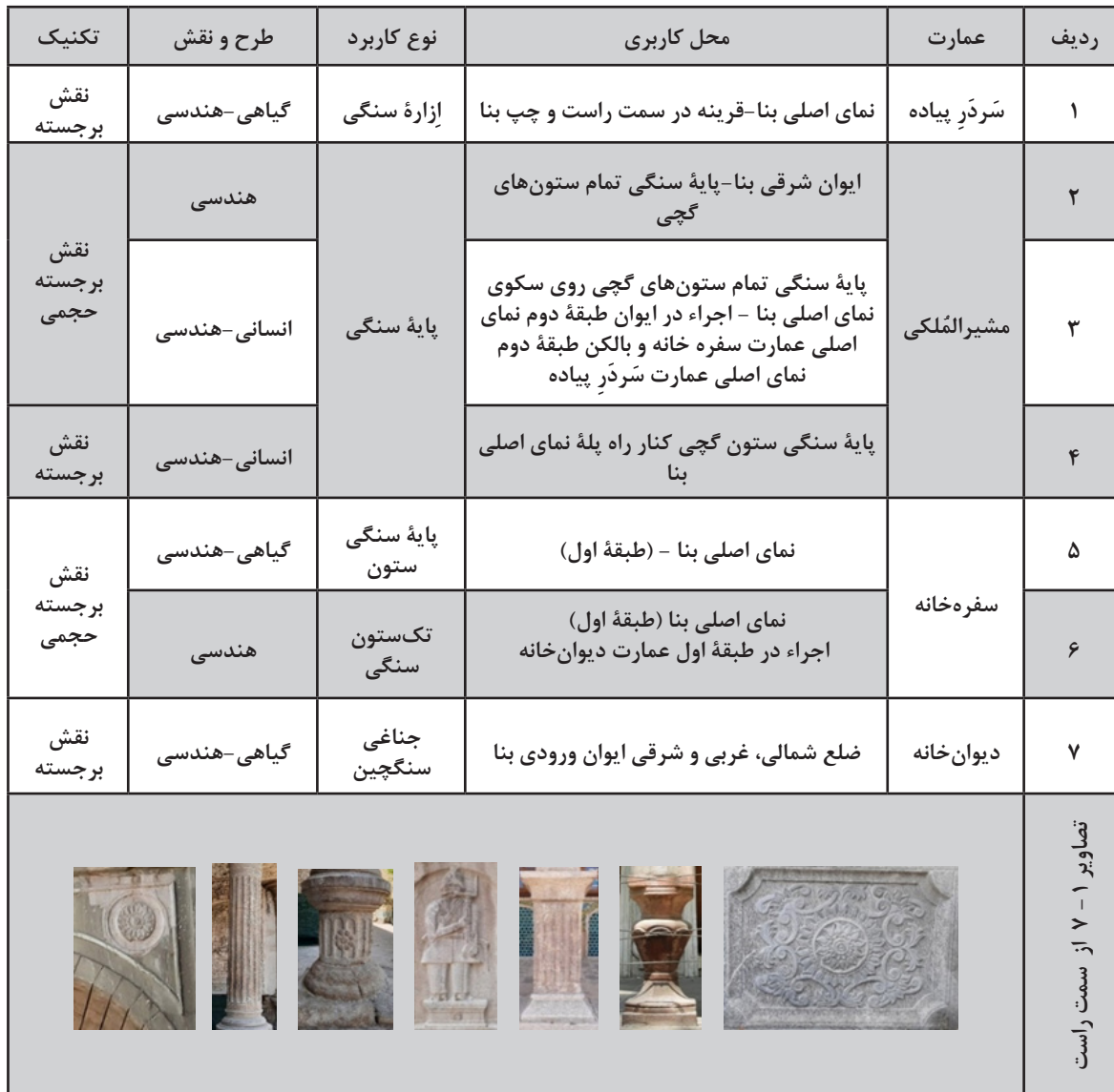
جدول ۹: تزیینات حجاری عمارت تاریخی مسعودیه

محراب‌ها، اِزاره‌ها، آب‌نماها، سنگ‌آب‌ها، حوض‌ها و پلکان‌ها استفاده می‌کردند... بخشی از تزیینات دورهٔ زندیه مانند نقش برجسته‌های سنگی عمارت دیوان‌خانه و نقش برجسته‌های سنگی نارنجستان قوام و خانهٔ زینت‌الملک در دورهٔ قاجار شبیه آثار سنگی قبل از اسلام‌اند که در سطحی بسیار نازل‌تر و ضعیف‌تر کنده‌کاری و حجاری شده‌اند» (مکی‌نژاد، ۱۳۸۷: ۲۰۲ و ۲۰۳).