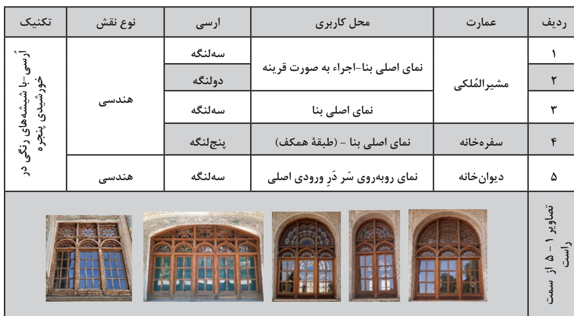
جدول ۶: تزیینات پنجره‌های ارسی عمارت مسعودیه

با پاتاق صاف در دیوار ضلع غربی و دیوار ضلع شرقی نمای اصلی عمارت دیوان‌خانه به‌کاررفته که احتمالاً نمایش‌گر تنوع در زیبایی پنجره‌های ارسی، در مجموعه مورد اشاره باشد. در ساخت تزیینات پنجره‌های ارسی این مجموعه نیز، از چوب چنار استفاده شده‌است. بیشترین کاربرد چوب در کل این مجموعه، در کنار شیشه‌های رنگی، ارسی‌ها بوده که به وجود آورنده یکی از شاخص‌های دوره قاجار، یعنی دودری، سه‌دری و پنج‌دری‌ها بود که همزمان فضاهای بیرونی و درونی را زینت می‌بخشید.