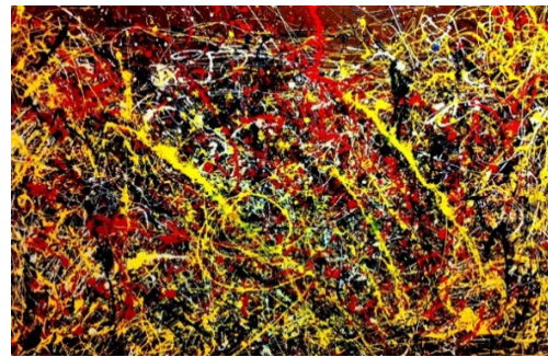
تصویر ۲. حسابدار، جکسون پولاک، ۱۹۵۲ م، رنگ روغن روی بوم، ۷۵×۴۹ سانتی‌متر (URL ۳).

بودن در فضاهای غلیظ تصویری عصر حاضر، به جهت توسعه فناوریهای ارتباطی، و تأثیر شگرف تکنولوژی بر چگونگی و سرعت تولید تصاویر، کلام‌محوری تا حدودی، جای خود را به تصویرمحوری در ارتباطات انسانی داده است، که به نظر می‌آید توجه به آموزش سواد بصری، از آن جهت که سواد بصری و خوانش تصاویر از منظر مخاطبین و مصرف‌کنندگان آن به موازات تولید و تکثیر تصاویر، پیشرفت چندانی نداشته ضرورتی اجتناب‌ناپذیر است، از این‌رو، هدف پژوهش حاضر امکان‌سنجی رویکرد نشانه‌شناختی برای توسعه و فراگیری سواد بصری برای عموم مردم است. یکی از نتایج کلی به‌دست آمده تعریفی جامع، از سواد بصری است، که همانند نظام نوشتاری، در خواندن و نوشتن اولیه خلاصه نمی‌شود، یعنی علاوه بر توجه به اصول نحوی و دستوری زبان تصویر، ویژگی‌های ساختاری آن مستلزم به کارگیری توانایی‌های ذهنی: از قبیل قدرت تجزیه و تحلیل، قیاس، استقراء، استدلال، ترکیب، تبیین، تفسیر، استنتاج، نقد و خلاقیت است، که رویکرد نشانه‌شناختی از قابلیت لازمه برای رشد و پرورش توانایی‌های ذهنی ذکر شده برخوردار است. لذا با یک نگاه روش‌شناسانه به این دانش، و استفاده از ابزار و اصول ساختاری آن که با گذر از نظام زبانی ممکن است، و تأکید بر نحو تصویری، مانند محور همنشینی و جانشینی در تصویر که از محورهای اساسی و بنیانی نظام نشانه‌شناسی است، همچنین، اصول تقابلی و تداعی در تصویر، که ماهیتاً معنایابی را به همراه دارند و بلاغت‌هایی، چون مجاز، استعاره، خطابه که زایش معنا را موجب می‌گردند، دلالت مستقیم، ضمنی و رمزگان‌ها در تصویر، به نظر می‌آید خوانش اصولی تصویر ممکن است. نتیجه به‌دست آمده نشان می‌دهد رویکرد نشانه‌شناختی از ظرفیت لازمه برای