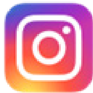
تصویر ۳. لوگوی اینستاگرام (URL ۲).

می‌کنند، تا با پشت سر گذاشتن محدودیت‌های زمان، مکان، فرهنگ، حتی زبان، آنان را با دنیاهای جدیدی آشنا سازند، محدودیت‌های مرزی را از بین برده و دهکده جهانی مورد نظر اربابان زور و زر را مهیا کنند، و بازنمایی‌ها را آن‌گونه که می‌خواهند به عنوان حقیقت نمایان کرده تا اندیشه‌ها را به بند بکشند.