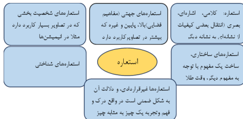
نمودار ۱. استعاره در نظام نشانه‌ای.

ساختارگراها بر اهمیت تقابل‌های جانشینی تأکید داشته‌اند و تحت تأثیر یاکوبسن، روش‌های تحلیلی اولیه‌ای که توسط بسیاری از نشانه‌شناسان ساختارگرا به کار گرفته شد شامل تعیین تقابل‌های معنایی دوتایی یا قطبی (مانند ما، ایشان، عمومی، خصوصی) که در متون یا فرآیندهای دلالتی بود. چنین جست‌وجوایی بر پایه نوعی «دوگانه‌نگاری» قرار دارد (چندلر، ۱۴۰۰: ۱۵۸). به نظر سوسور، واژه‌های تقابلی دارای کارکردی عملی در زبان محسوب می‌شوند، زیرا که این تقابل‌ها زمینه تفکیک و دسته‌بندی را فراهم می‌سازند. یاکوبسن ضمن تأسی از اندیشه‌های سوسور، مدعی شد که واحدهای زبانی در چارچوب نظامی از تقابل‌های دوتایی به هم پیوند می‌خورند. این‌گونه تقابل‌ها برای افاده معنی امری ضروری محسوب می‌شوند (ضمیران، ۱۳۸۲: ۹۱).