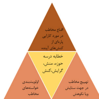
نمودار ۲. خطابه.