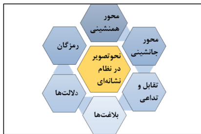
نمودار ۵. نحو تصویری در نظام نشانه‌ای.

نحو تصویری، روابط ساختاری بین عناصر و نشانه‌های متن تصویری را بررسی می‌کند (نمودار ۵). برعکس نظام نوشتاری، نشانه‌ها و روابط بین عناصر تصویری کاملاً قراردادی نیستند. در شیوه دلالتی تصویر، پیام‌ها و معانی تنها حاوی اندیشه‌های عقلائی و منطقی ناب نیستند، بلکه تولید کننده، اصولاً نگرش و احساسات خود را نسبت به موضوع بیان می‌کند. حال با عبور از عناصر فرمی، که شکل و ساختمان ظاهری تصویر (ریخت‌شناسی) را تشکیل می‌دهند، هر چند عناصر ریخت‌شناسی تصویر همانند عناصر ریخت‌شناسی نوشتاری (حروف) بی‌معنا و قراردادی نیستند که فقط در صورت ترکیب به صورت قراردادی معنا دار شوند، بلکه هر کدام از این نشانه‌های بصری خود دارای بیان و معنا هستند که به صورت حسی توسط مخاطبین قابل دریافت است، مثلاً خطوط تیز برای همه انسان‌ها تنش‌زا است. این عناصر بصری هم بیان و معنایی جهانی دارند و هم می‌توانند معانی محلی و منطقه‌ای داشته باشند، نحو تصویری در نظام نظام نشانه‌ای مورد بررسی قرار می‌گیرد.