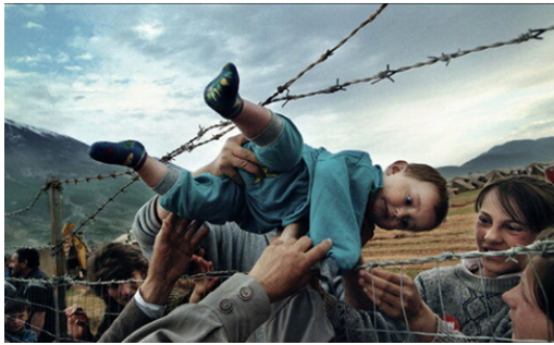
تصویر ۱.

تصویر ۲، از تابلوهای جکسون پولاک ۲۱ ، متشکل از خطوط در ضخامت‌های متفاوت، نقطه، رنگ‌های تند، خالص و خاکستری است، و به لحاظ پویایی: حرکت، ریتم، اندازه، هماهنگی، بافت و تعادل را شامل است، که در یک همنشینی مکانی، قابلیت تولید معنا را دارا هستند، هر چند این تابلو با پرتاب تصادفی رنگ‌ها با قلم‌مو بوجود آمدند، اما از ترکیب‌بندی منسجمی برخوردار است، زیرا به صورت یک کل قابل دریافت است. همان‌طور که می‌دانیم عناصر بصری و بنیادی در نظام نشانه‌های تصویر برعکس نظام نوشتاری دارای بیان و معنا هستند. لذا با استفاده از این ویژگی در این تابلو، با خطوطی در اندازه‌ها و شکل‌های گوناگون مواجه هستیم که در یک همنشینی تصویری هویت وجودی هم را تقویت می‌کنند و احتمالاً به دنبال بیان کشمکش و آشفتگی در نوای زندگی انسان مدرن است. بیان موسیقایی خطوط منحنی و مدور با پیچ و تاب‌های ناگهانی نشان از خودبیگانگی، خلسه و فرو رفتن در گردابی است که گریزی از آن نیست، با دقت در آن می‌توان چند نت موسیقی را تشخیص داد سمفونی که هماهنگی و تعادل را در عین آشفتگی دارا می‌باشد به نوعی این تز و سنتز این تقابل‌های درونی در حال تولید معنا هستند. رنگ‌های تند قرمز، زرد و سیاه در تداعی‌های معنایی، دلالت از تنش، ناامنی، ستیز و ناامیدی است. البته در نگاهی دیگر می‌توان شور و هیجان، حرکت را خوانش کرد. او با یک سبک شخصی، مرزها را در می‌نوردد و همه جهانیان را به تماشای تابلوی خود فرا می‌خواند تا به آن‌ها بگوید این جهانی است که ما در آن زندگی می‌کنیم. تصویری که او از جهان پیرامونی خود دارد را با رنگ‌های مهیج، خطوط آشفتنه، چون بالرینی که بر روی شیشه‌های شکسته و نوک تیز به رقص در آمده نشان می‌دهد.